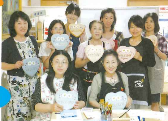
トールペイントサークルのパーシモンの皆さん