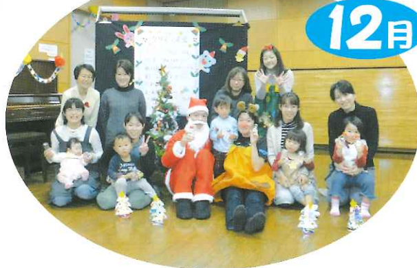
エブロンポケットの皆さん