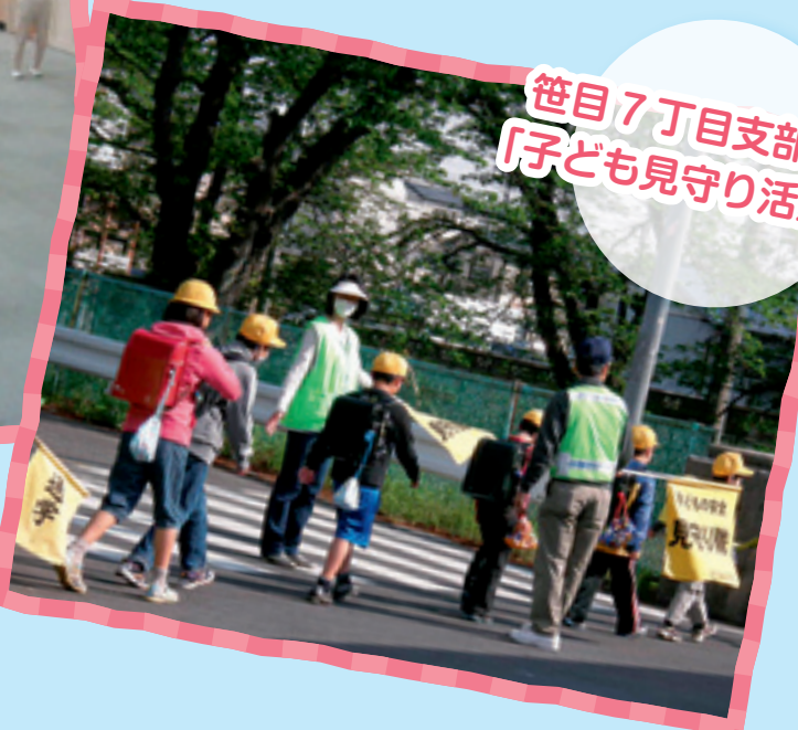
笹目7丁目支部の 「子ども見守り活動」