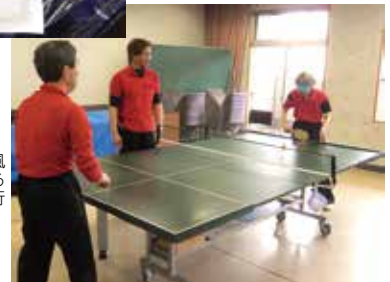
サウンドテーブルテニス風景。ボールの音に集中するため、試合は歓声も無く行うそうです。