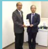
ケイアイ株式会社様より