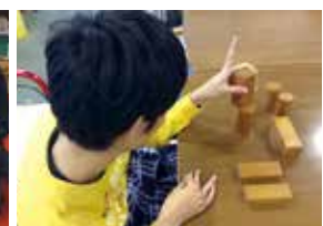
積み木を使った指先の訓練