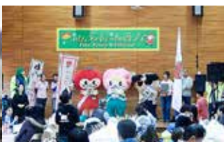
在宅障害児家庭クリスマス会事業