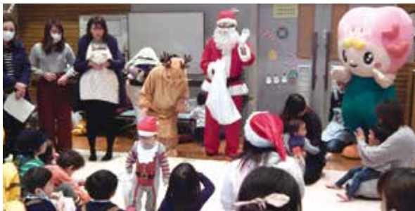
子育てサロン【北戸田住宅支部】

支部（町会・自治会）での子育てサロンやリズム体操などの推進、地域福祉推進を目的としたセミナーや研修会の開催など