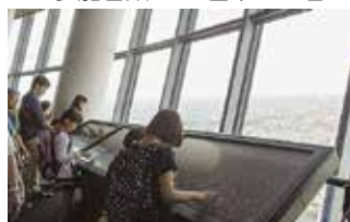
在宅障害児家庭交流事業