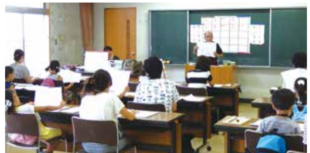
小学生親子ボランティア学習

ボランティアセミナーや手話講習会、小学生親子ボランティア学習等の講座の開催や、ボランティア相談、ボランティア情報誌の発行など