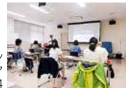
ボランティアセミナー