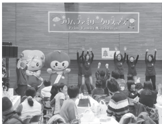
在宅障害児家庭クリスマス会事業