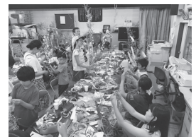
まごころこども塾