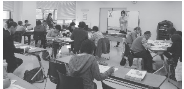
グループワークは大盛り上がり

生活支援サポーターとは、隣近所の“さりげない気遣い”、“ちょっとした目配り”など地域に関心を向けていただく応援者のことです。講座内容、参加申込方法については8月の広報戸田市に掲載します。