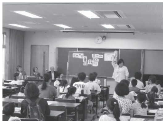
参加型の体験がいっぱい