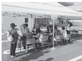
災害ボランティアセンター立ち上げ訓練