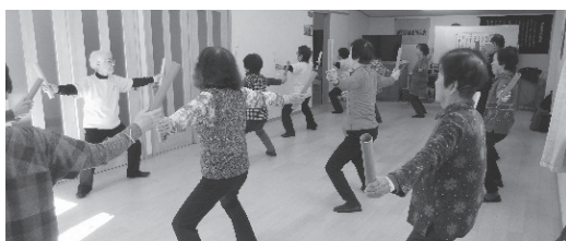
リズム体操【鍛冶谷支部】