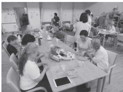
高齢者施設での活動