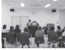
子育てサロン交流会