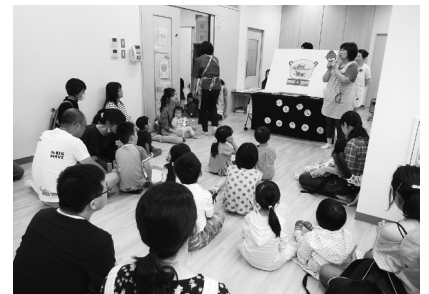
つみきの部屋(パネルシアター)