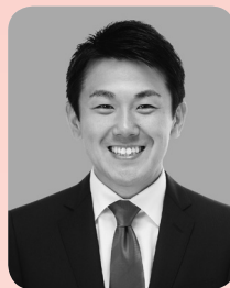
戸田市長 菅原文仁

結びに、市民の皆様のご健勝とご活躍を心より祈念申し上げまして、新年のあいさつとさせていただきます。