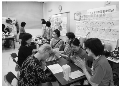
参加団体ブース(手話体験)

なお、社会福祉協議会ブースでご寄付いただきました募金は、埼玉県共同募金会へ送金いたしました。ご協力ありがとうございました。