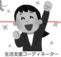
生活支援コーディネーター