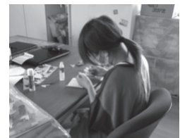
保育園での バスデーカー作り