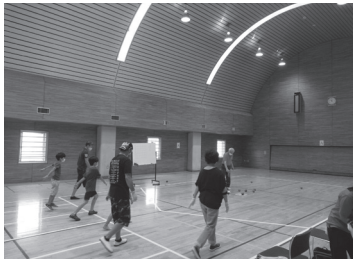
昨年度のポッチャ体験の様子

市内小学生2～4年生の親子が対象。障害者への理解を深め、思いやりの心を育むことを目的に開催します。