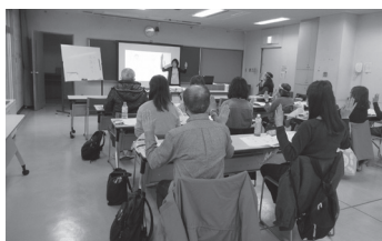
一緒に活動する仲間ができます