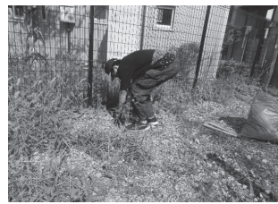
高齢者施設での草むしり