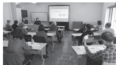
戸田市のクイズに「○、×」札を上げてもらい楽しく行いました

生活支援サポーターとは、地域に関心を向けていただく応援者のことです。本会では、ゴミ捨てなどの日常生活のちょっとした手助け（生活支援ボランティア）を行っていただく方を募集しています。