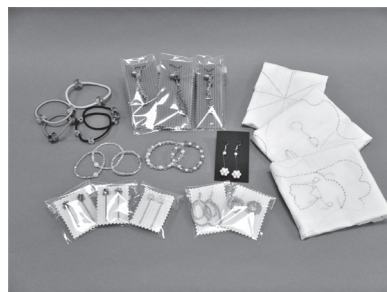
ふきん、ビーズストラップ等