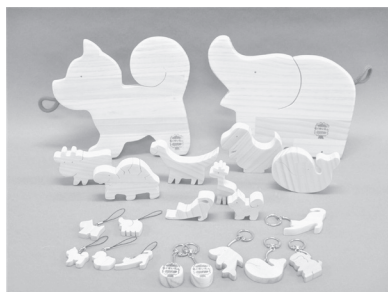
木工製品(なべしき、キーホルダー等)