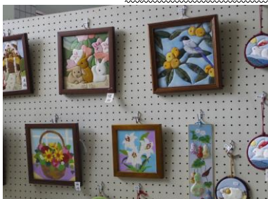
※リハビリ友の会のみなさんの作品です。

手先を動かす簡単な手芸や皆で楽しく おしゃべりしたり、和やかな雰囲気の中 で活動しています!! 男性もちろん大歓迎です! ぜひ一度見学にお越し下さい。