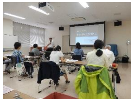
ボラン ティア 入門学