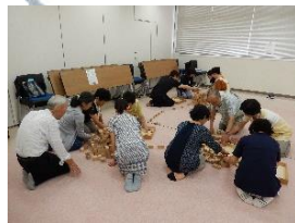
託児ボランティア