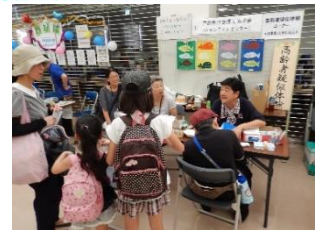
本会のブース（高齢者疑似体験）にもたくさんの方が！

戸田市健康福祉の杜まつりが、10月7日（日）に開催されました。当日は、10月にも関わらず、暑い日でしたが、1,400名を超える多くの方々にご来場いただきました。ステージ発表や、各ブースも大いに盛り上がっていました。