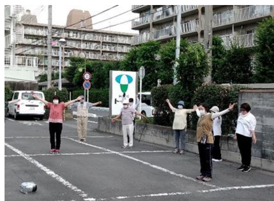
地域の活動（ラジオ体操） （生活支援コーディネーター連携事業）