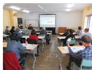
生活支援サポーター養成講座