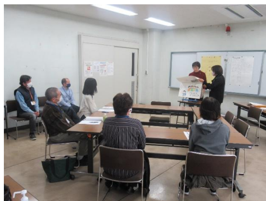
ボランティア入門講座