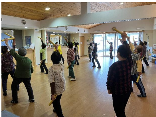
支部活動活性化事業（リズム体操）