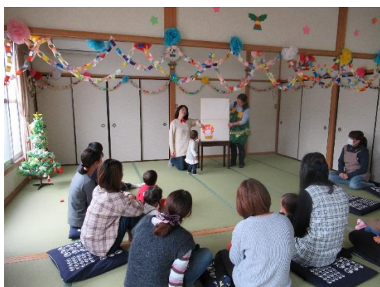
支部活動活性化事業（子育てサロン）