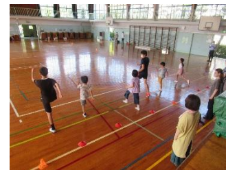
夏休み・冬休みまごころこども塾 かけっこ教室