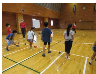
小学生親子ボランティア学習