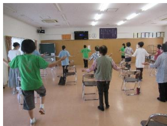
支部活動 元気体操