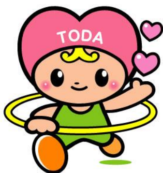
戸田市社会福祉協議会 マスコットキャラクター 「トッピー」