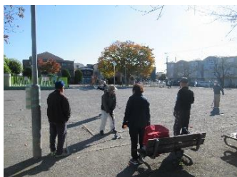
支部活動 グラウンドゴルフ

支部の子供たちが地域への関心を高め、地域の方々とのつながりを通して人を思いやる心の醸成と地域への関わりのきっかけづくりを目的に実施します。