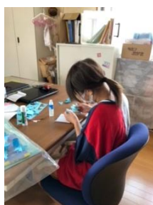
彩の国ボランティア 体験プログラム