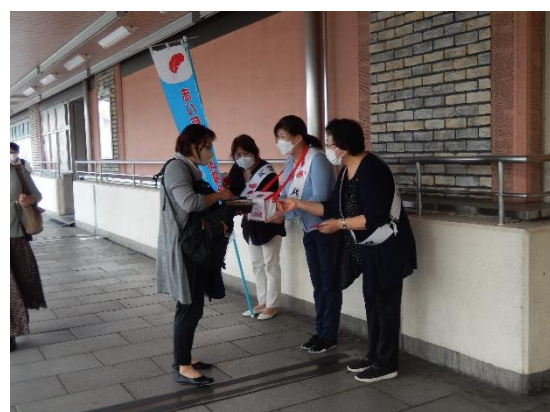
共同募金運動（街頭募金）