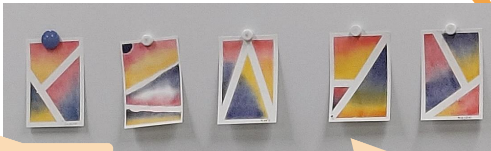
参加された皆さんの パステルアート