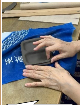
手びねりの陶芸です。