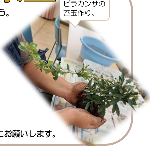
ピラカンサの苔玉作り。