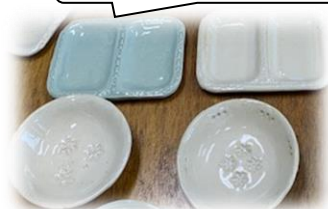
受講者さんの陶芸作品。