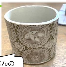
受講者さんの 陶芸作品。