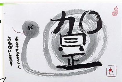
受講者さんの書いた 己書年賀状。