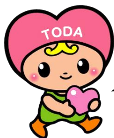
戸田市協マスコット トッピー

入れ歯は汚れを落とし、熱湯か入れ歯洗浄剤(除菌タイプ)で消毒して、新聞等の厚手の紙で入れ歯を包み、回収ボックスに備え付けのビニール袋に入れて投入してください。