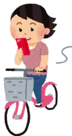
スマホを見ながら走行