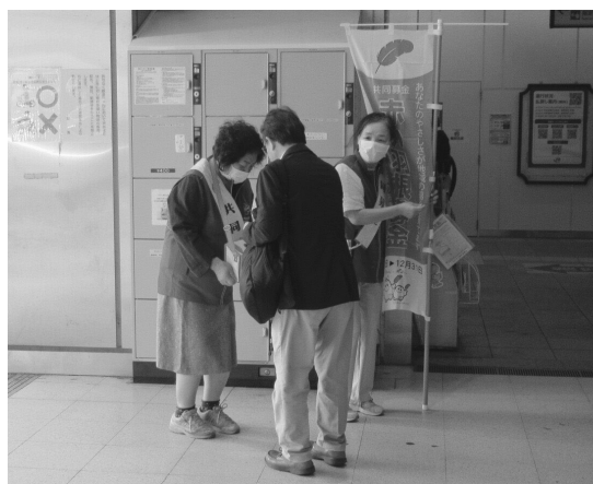
【令和6年度民生委員・児童委員による街頭募金】

共同募金には、「赤い羽根共同募金」と「地域歳末たすけあい募金」があります。募金の説明、主な使い道については、次のページをご覧ください。