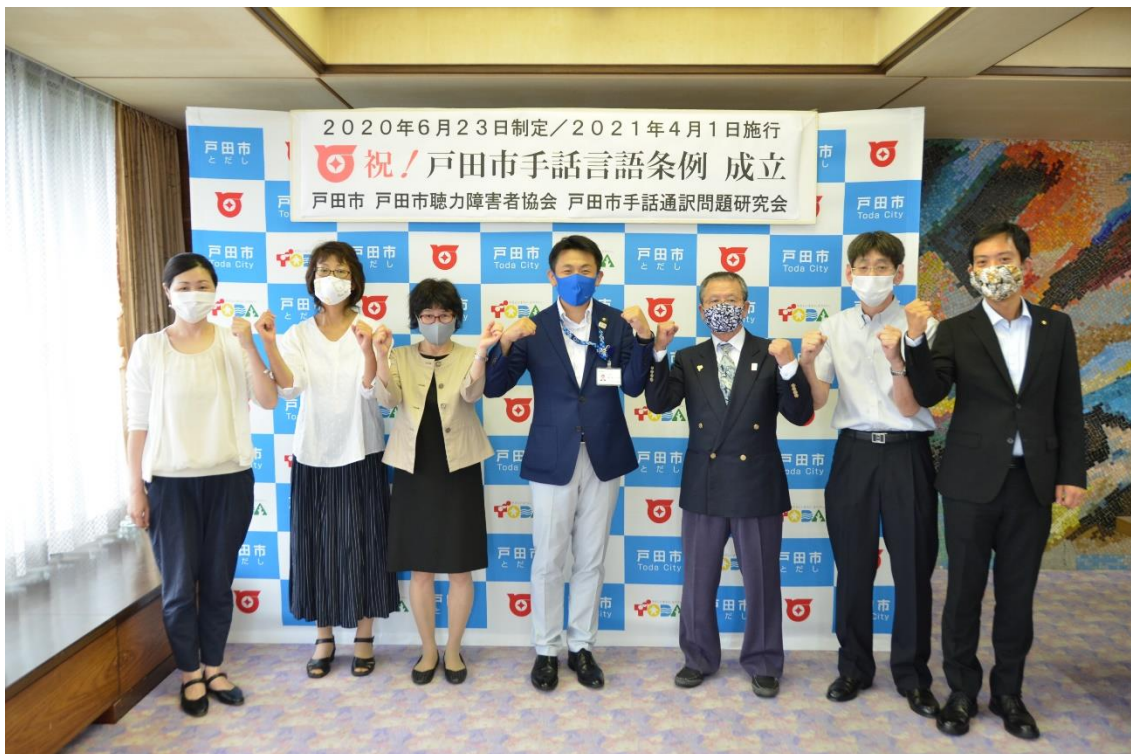
条例制定記念撮影の様子

2020年6月23日の戸田市議会にて、「戸田市手話言語条例」が制定されました（2021年4月1日施行）。この条例では「手話は言語であることの基本理念のもとに、ろう者を含む全ての人がお互いに尊重し合い、支え合って暮らしていける社会を目指す」としています。戸田市手話通訳者派遣事務所としては、手話通訳者の派遣や広報活動等を通じて、手話が言語であることの普及、環境整備等を行っていきます。