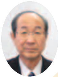
社会福祉法人 戸田市社会福祉協議会