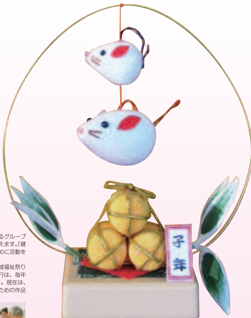
リハビリ友の会の方による作品です