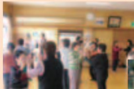
新曽下町支部 「ふれあいほつろつサロン」の様子

支部活動活性化事業には、社会福祉協議会会費が使われています。社会福祉協議会会費についての詳しい内容は、5ページをご覧ください。