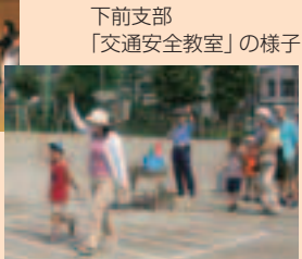
下前支部 「交通安全教室」の様子