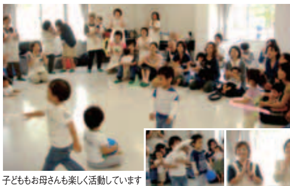
子どもお母さんも楽しく活動しています