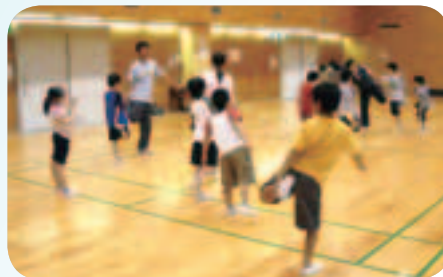
みんな楽しく頑張っています！

心身障害児を対象に毎週金曜日に軽体育室で実施している体操教室の、いつもの始まりの一コマです。1時間の間に、ストレッチ、模倣運動、ランニング、ボール、平均台、縄跳び等、子どもたちは思いっきり体を動かします。時にはいたずらをし過ぎて先生にしかられることも。1年間の間にみんなぐんぐんと体も心も伸びていきます。先生、ボランティアさんたちも活き活きとした子どもたちの姿に元気をもらっています。