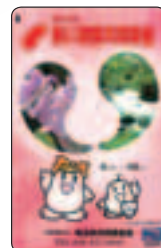
③図書カード1,000円 (利用額500円相当) (内 募金額500円)