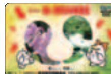
②クオカード1,000円 (利用額500円相当) (内 募金額500円)