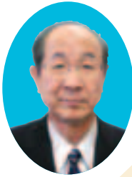
社会福祉法人 戸田市社会福祉協議会