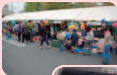
登録団体による 活動発表・模擬店

当日は、商工祭・とだ環境フェア・健康フェスティバルなども行われ、ボランティア・市民活動支援センターへ多くの方が来られました。