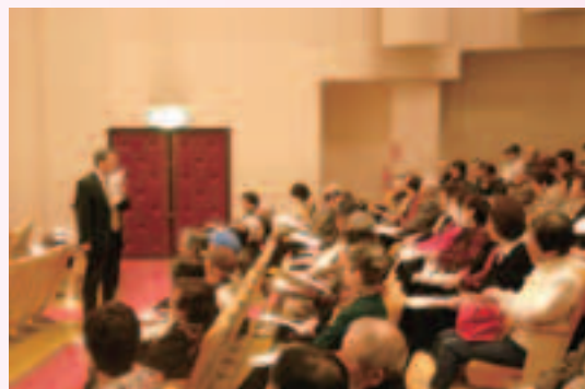
講師の話しを熱心に聞く参加者

終了後には、参加者から孤独死を防ぐには日ごろからの地域の関係が重要との声が聞かれ大変有意義な講演となりました。