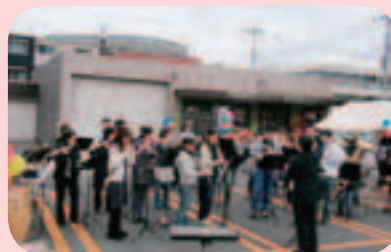
戸田市コンセール・ ルネッサ吹奏楽団

センター前の駐車場では、登録団体による活動発表など が行われ、ダンス、ゴスペル、犬のパフォーマンス、ハー モニカ、吹奏楽などを披露する団体で盛り上がりしました。