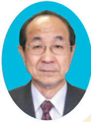
社会福祉法人 戸田市社会福祉協議会