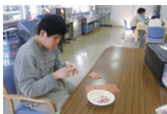
色紙もたくさん切らなくちゃ！

今回の表紙は、社会福祉協議会が管理運営する障害者施設の「戸田市立福祉作業所もくせい園」の利用者が、作成しました。