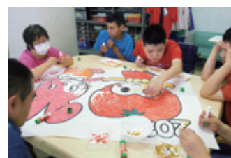
貼って、貼って…だんだん色が付いてきたよ。

ボランティア・市民活動支援センター「TOMATO」は、市民・市・社会福祉協議会が共同で運営しています。「TOMATO」の名前の由来である「“と” だの“ま” ちでみんな “と” もだち」と、手を繋いだデザインの通り、戸田市の地域福祉を担う団体として、市民の皆様と手を取り合って地域福祉を進め、これからも皆様の活動を支える団体であり続けられるよう願って、デザインされました。