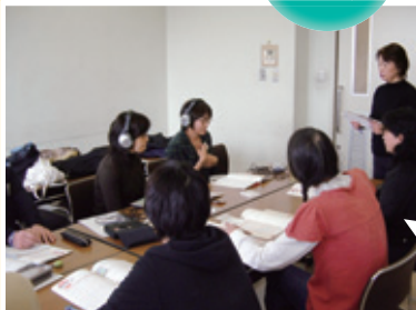
ヘッドホンを付けて、聴覚障害者の体験をしながらのロールプレイ