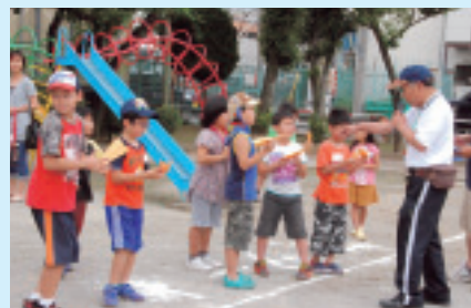
笹目5丁目支部の様子