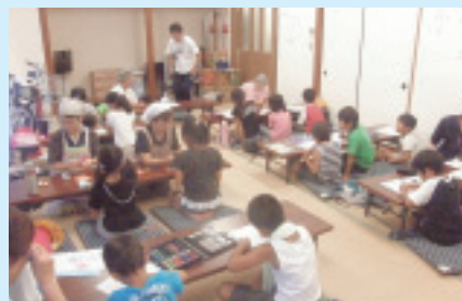
美女木1丁目支部の様子