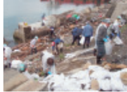
第1回目の作業中の様子

私たちが現地に入ってまず目にしたものは、震災から数カ月が経つ今なお海に漂う民家や海岸から何キロも離れた高台の土地に残る津波の傷跡、また、どこまでも平坦でほとんど建物らしき物の無い市街地の所々に高く積み上げられた瓦礫や車両の