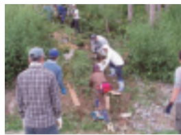
第2回目の作業中の様子