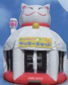
ラッキーキャット