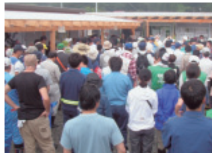
災害ボランティアセンターに集まるボランティア

た場所に海側から打ち寄せられる家屋等の瓦礫の撤去作業でした。第2回目は、個人の方から要請で、津波が堤防を越えて多くの住宅を山側へ押し流した地域