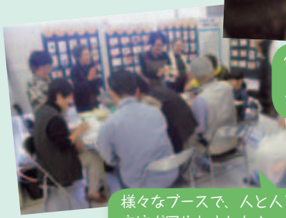
体験ブースでクリスマスツリーを手作り★おみやげができたね！！