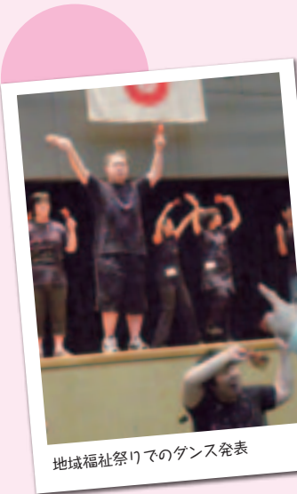
地域福祉祭りでのダンス発表

もくせい園は、障害者福社会館内にある戸田市社会福祉協議会が管理運営する指定生活介護事業所です。障害のある方が通って、自主製品の製作等の生産活動や折り紙等の創作的活動、ダンスや調理等のレクリエーションや機能訓練（リハビリテーション）を行っています。昨年は施設のスペースを拡げ、個々の利用者の状況に合わせたより適切な支援や新たな活動ができるようになりました。今年も利用者の皆さんが、安心して充実した毎日を過ごせるよう、ご家族や地域の方々と協力して事業をすすめていきます。