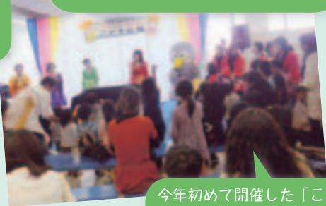
今年初めて開催した「こども広場」は、たくさんの親子の笑顔で溢れました☆