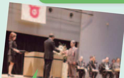
式典では、地域福祉活動の振興に貢献して下さった方々への表彰が行われ、たくさんの拍手が送られました。