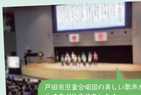
戸田市児童合唱団の美しい歌声から式典が始まりました♪

平成24年度戸田市地域福祉祭り・ふらっと広場“TOMATO” 東日本大震災義援金 32,726円