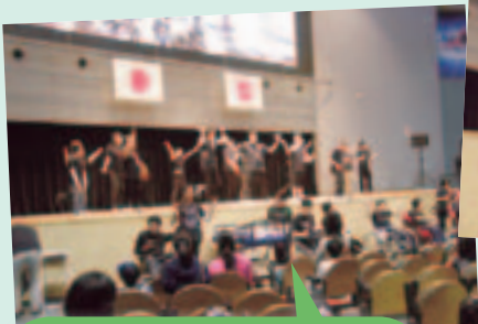
もくせい園のダンスはAKB48の「ヘビーローテーション」と「さあさ、みんなでどっこいしょ」会場も一緒にになって踊りました。