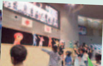
ドテレンジャーショーで子ども達も大盛り上がり！！カッコいいね☆