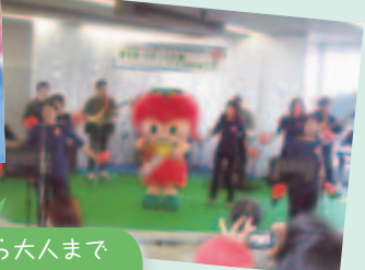
ふらっと広場のステージでは、子どもから大人までみんなで素敵な音楽を楽しみました♪