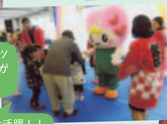
トッピーも大活躍！！