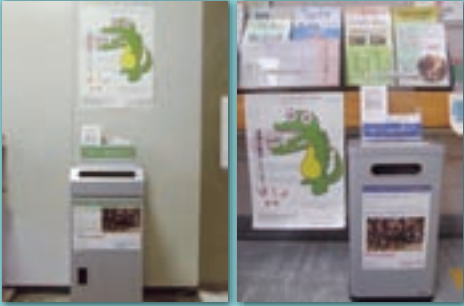
①戸田市役所 2階ロビー ②戸田市障害者福祉会館 1階受付