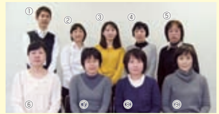
平成25年度 戸田市社会福祉協議会の 手話通訳者です