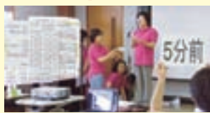
《前回の公開プレゼンテーション風景》

ホームページアドレス: http://www.todashakyo.or.jp/