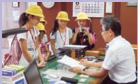
▶ 後谷支部 (市役所訪問： 市長の仕事見学)