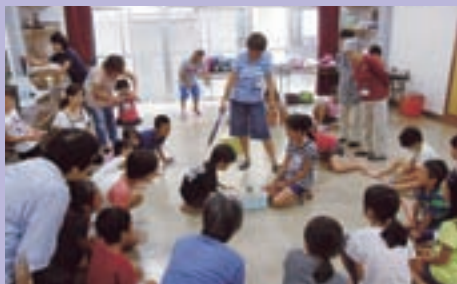
◀ 笹目北町支部 (昔遊び： 紙相撲で対決)