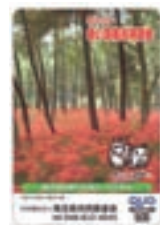
②クオカード 1,000円 (利用額 500円)