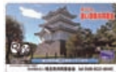
③図書カード 1,000円 (利用額 500円)