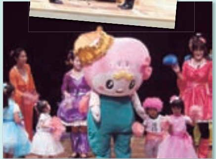
イベントホールでは、社会福祉協議会の表彰や団体の発表等が行われました