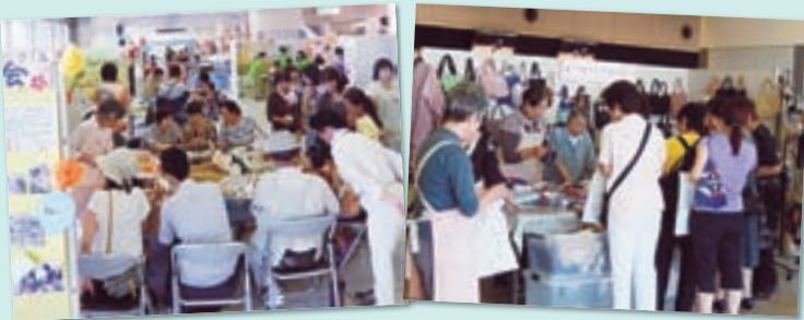
団体ブースや体験コーナーは、多くの人で賑わいました

こども広場では手遊びや、じゃんけん大会など親子で楽しめるステージショーが催されました