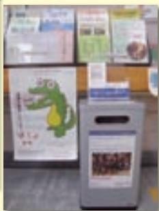
②戸田市障害者福祉 会館1階受付