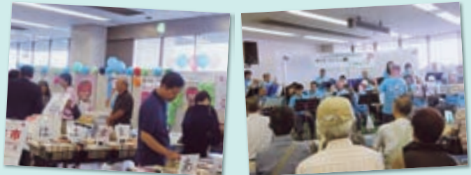
ふらっと広場“TOMATO”では、戸田市ボランティア・市民活動支援センター有志で『古本市』を企画・運営しました。総額 19,165 円の義援金が集まり、埼玉県共同募金会戸田市支会を経由して被災地に送らせていただきました。