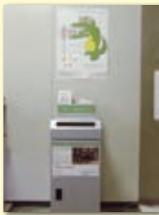
①戸田市役所 2階ロビー