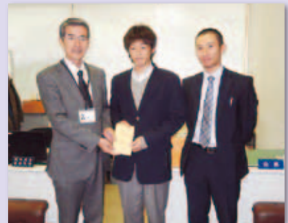
東日本大震災義援金戸田翔陽高校様より

問合せ 埼玉県共同募金会戸田市支会 (戸田市社会福祉協議会) ☎ : 442-0309