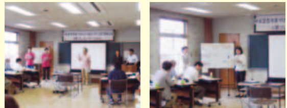
《前回の公開プレゼンテーション風景》

問合せ 戸田市社会福祉協議会 戸田市川岸2-4-8（障害者福祉会館内） ☎：442-0309 FAX：442-3996 ホームページアドレス： http://www.todashakyo.or.jp/