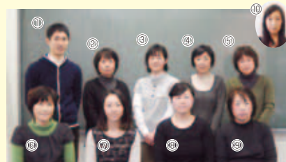
平成26年度 戸田市社会福祉協議会の手話通訳者です