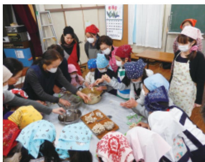
美女木8丁目支部 三世代交流