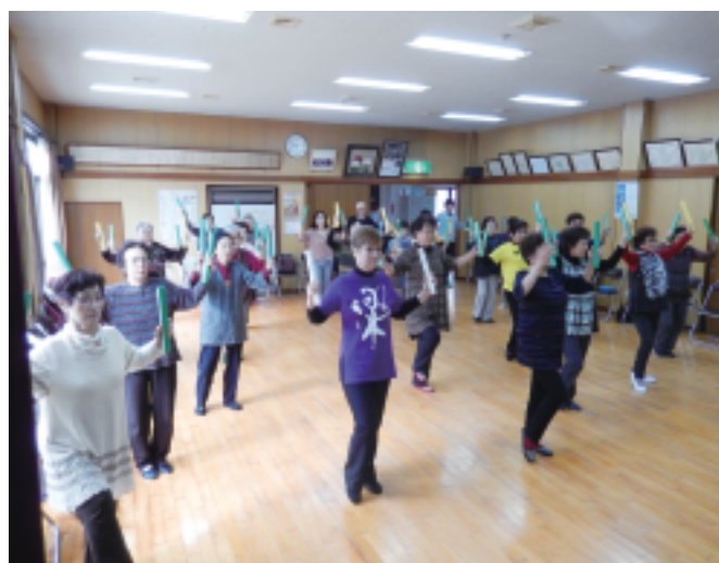
新曽下町支部 リズム体操