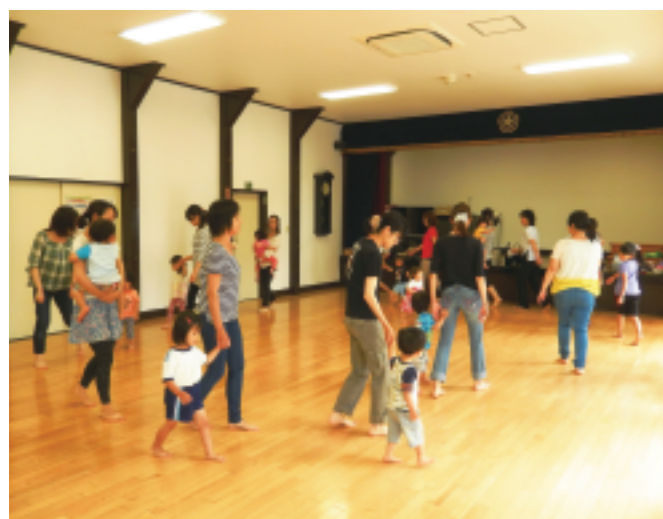
中町支部 おやこ体操教室