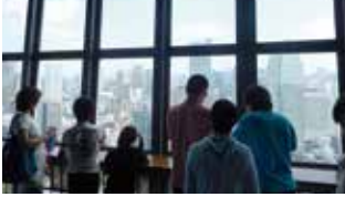
在宅障害児家庭交流事業