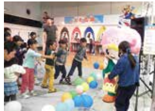
戸田市地域福祉祭り