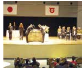
戸田市地域福祉祭りにおける表彰式

本会が実施する地域福祉活動の振興に貢献し、その功績が顕著、またそれに準ずる功勞のあった個人又は団体等への表彰・感謝を実施。