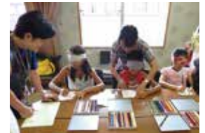
小学生親子ボランティア学習

手話講習会（入門・初級）、ボランティア相談会（はじめてのボランティア）、彩の国ボランティア体験 プログラム事業、小学生（2～4年生）親子ボランティア学習