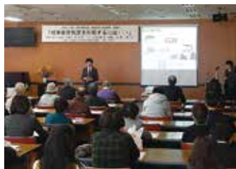
成年後見セミナー