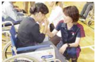
車椅子ダンス入門講習会