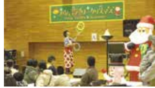
プリムファミリークリスマス事業