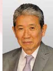
戸田市長 神保国男

結びに、市民の皆様のご健勝とご活躍を心より祈念いたしまして、新年のあいさつとさせていただきます。