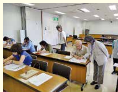
ボランティアセミナーの様子