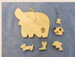
木 工 (なべしき、動物のおもちゃなど)