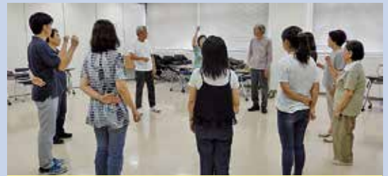
ボランティアセミナー

ボランティアの交流、仲間づくりのお手伝いや、ボランティア保険の受付を行っています。また、学校や施設でのボランティア活動の紹介、講師の派遣、福祉学習に必要な備品等の貸し出しをしています。