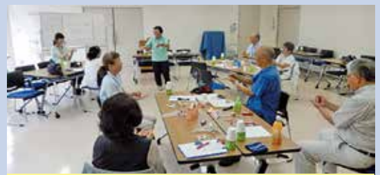
フォローアップ講座