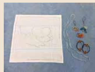
縫 製 (ふきん) ビーズ (メガネコード、髪ゴムなど)