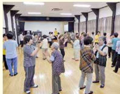
リズム体操の様子

・ボランティアの相談やボランティア情報誌の発行、ボランティアセミナーや手話講習会等のボランティア講座の開催など