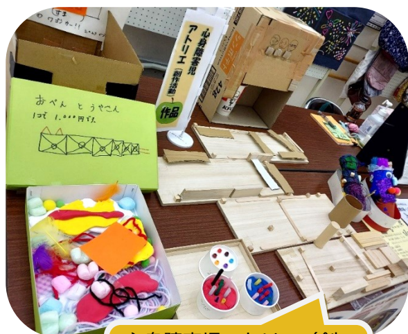
心身障害児アトリエ（創 作活動教室）参加者の作 品展示。