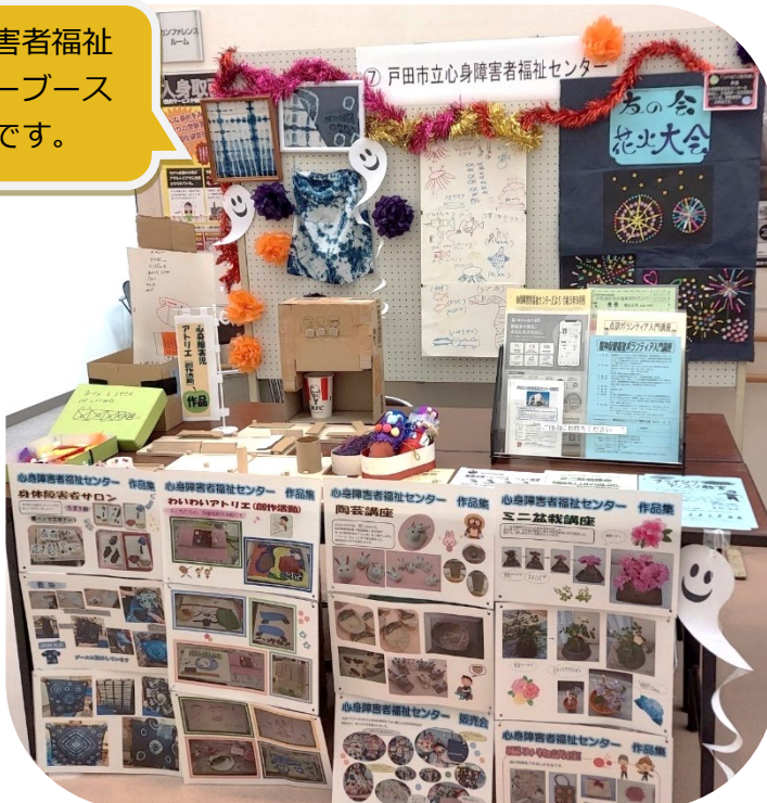
心身障害者福祉センターを拠点 に活動している身体障害者の会 「リハビリ友の会」の作品も展 示しました。

今回は、身体障害者サロンで 作った藍染めのハンカチや、 心身障害児アトリエでの作品などの展示をしました。 たくさんの方々にご来場いただきました。 ありがとうございます。