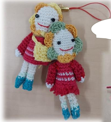
かわいい ストラップ