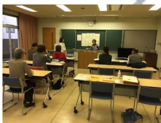
点訳ボランティア講座

今回は、一部、講座の様子や、今回修了された皆さんの声を紹介します。ボランティアセミナーにご協力を頂きましたボランティア団体・個人の皆様、関係各所の皆様、誠にありがとうございました。