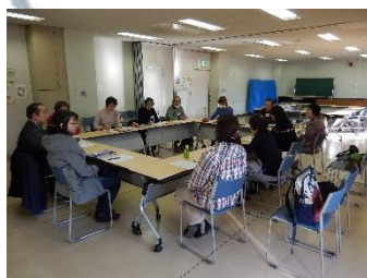
私のボランティア体験談