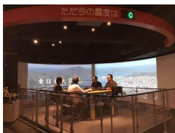
池袋防災館 (地震体験)