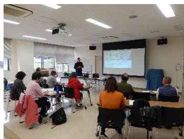
災害ボランティア講座