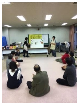
託児ボランティア講座