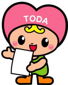
戸田市社会福祉協議会マスコット キャラクター「トッピー」

今月号は、戸田市社会福祉協議会（戸田市ボランティアセンター）へ登録されている、ボランティア団体所属の皆さま・個人の皆さま全員へお送りしています。